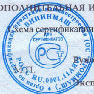
Схема сертификации 3а